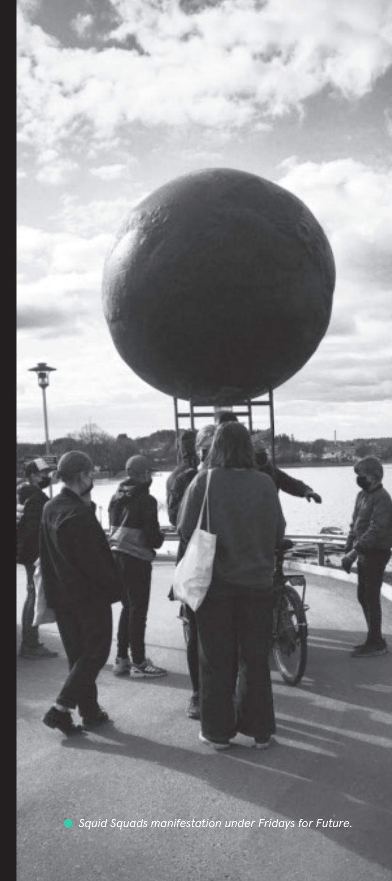
● Squid Squads manifestation under Fridays for Future.

Squid är engelska och betyder blåskfisk. Den är en symbol för kreativitet och kollektiv intelligens.